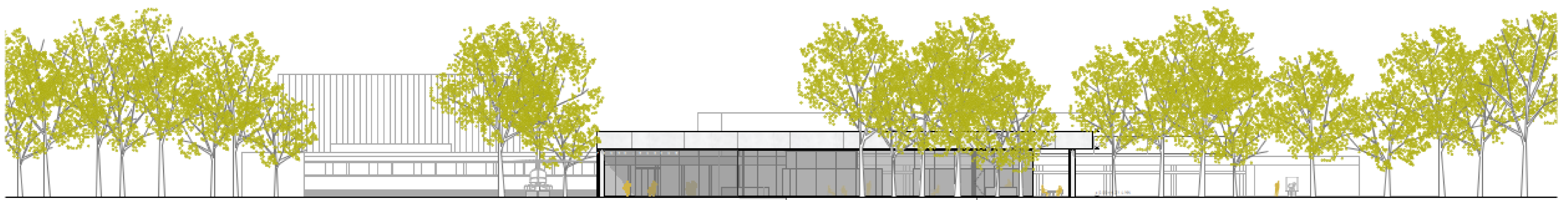
Ansicht Südwest 1:200